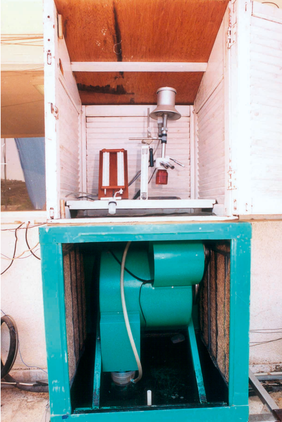
شكل (٢). المكيف الصحراوي وكشك الأرصاء من خارج المعمل.