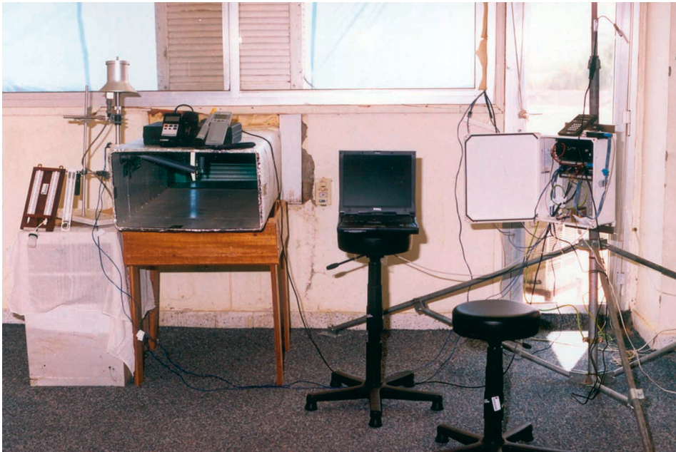
شكل (٣). مكونات التجربة من داخل المعمل.

ولقد تم القيام بمعايرة الأجهزة قبل إجراء التجارب في حجر معايرة (حضانة) تابعة لقسم الأرصاد بكلية الأرصاد والبيئة وزراعة المناطق الجافة بجامعة الملك عبد العزيز بجدة، وتمت معايرة الأجهزة بدقة متناهية لتجنب الأخطاء حيث تم وضع كل أسلاك الثرموكابل وعنصر قياس درجة الحرارة (Probe) في غرفة المعايرة وبعد ذلك تم البدء في المعايرة بتدريج درجات حرارة غرفة المعايرة من خمس درجات مئوية إلى خمسين درجة مئوية مع أخذ القراءات كل خمس درجات مئوية وتسجيل قراءة غرفة المعايرة (Y) وقراءات درجات الحرارة (X) وبعد الانتهاء من المعايرة تم تطبيق معادلة الانحدار ( Y=aX-b ) من خلال البرنامج الإحصائي بالحاسب الآلي. والسبب وراء أخذ عنصر قياس درجة الحرارة هو لزيادة التأكد من صحة البيانات وقت التجربة. وبالنسبة