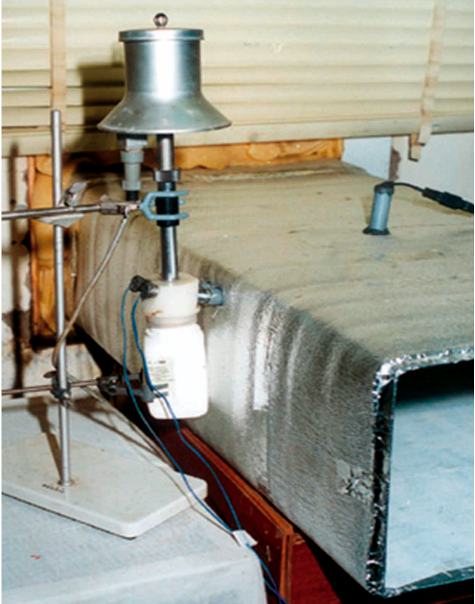
شكل (١). وضع مجسات الترموكابل لقياس درجة حرارة الترمومتر الجاف والمبلل داخل جهاز به مروحة لشفط عينة من الهواء الخارج من المكيف على المجسات.